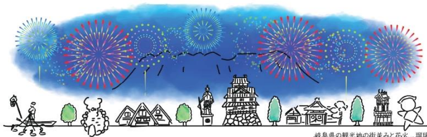
岐阜県の観光地の街並みと花火... 瑠璃

1 Gifu Aphasia National Conference in Gifu Aphasia National Confer